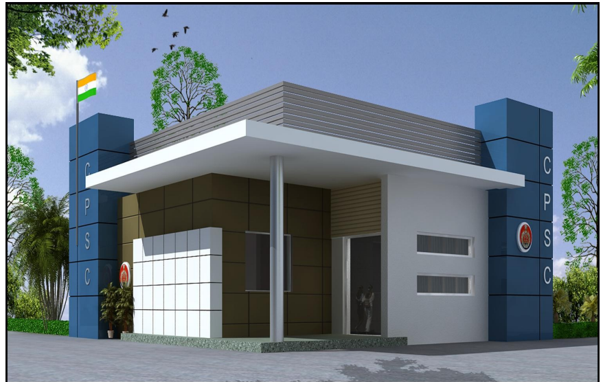
2. Sub-division SAANJH Kendra