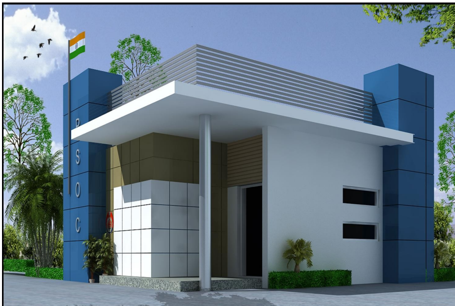
3. Police Station SAANJH Kendra