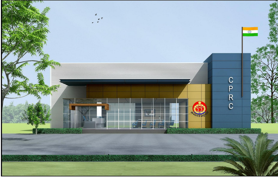
1. District SAANJH Kendra